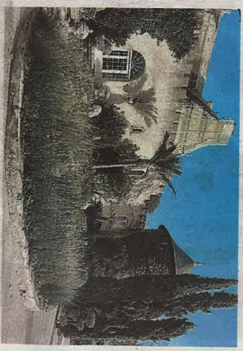
La façade sud, avec l'entrée principale du château, est en travaux.

Il n'y resta pas longtemps puisque l'Étienne Balme et Eugène Laures de Murviel en firent l'acquisition. Le 2 mars 1826. Enfin, le 22 décembre ceux-ci le vendirent au marquis de Thézan-Saint-Génies