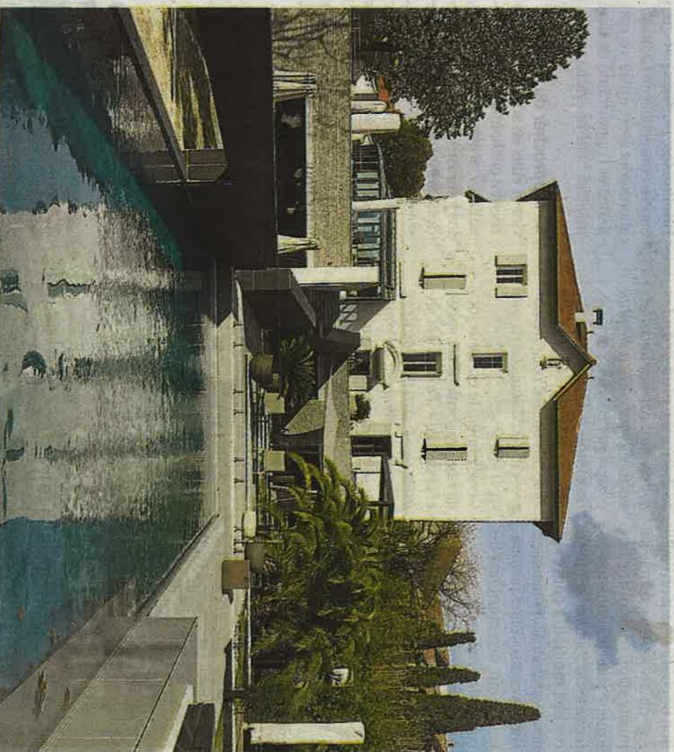
Situé tout près du cœur du village, le château Autignac abrite quatre chambres (La Tour, La Murrelle, Le Pech, Castel Viel) et une suite (Taberrolles) de grand charme. Toutes portent le nom d'une parcelle des Prés Lasses.